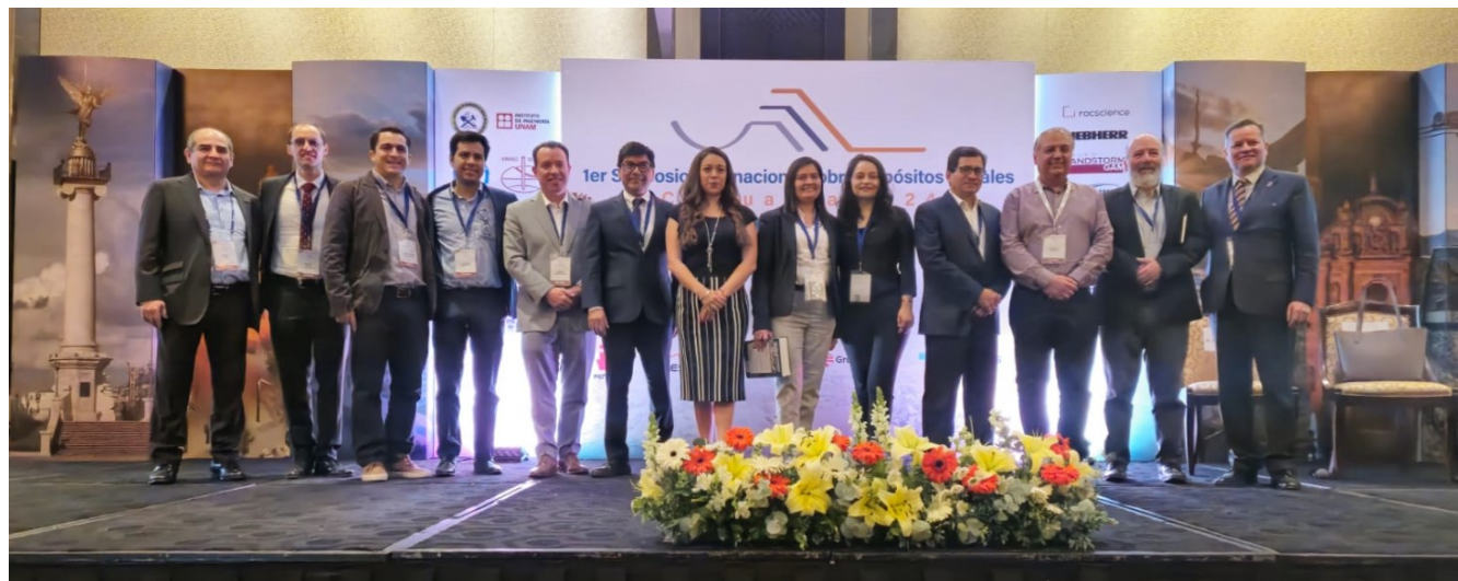
Figura 5. Comité Organizador, Comités Técnico, Editorial, Local y Asesor.