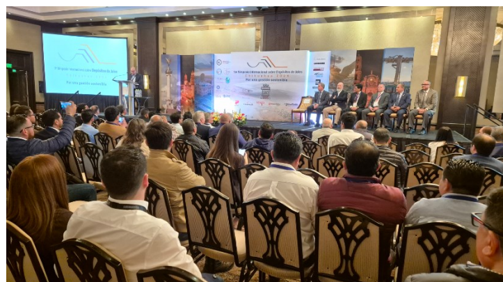
Figura 3. En la ceremonia de inauguración.