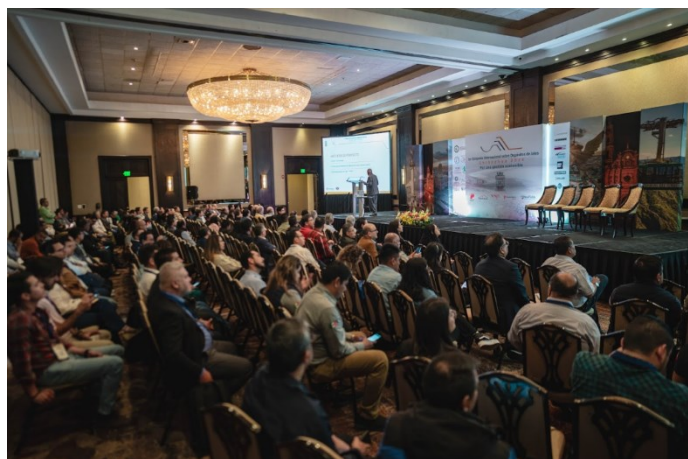
Salón Diamante, Conferencias Plenarias.