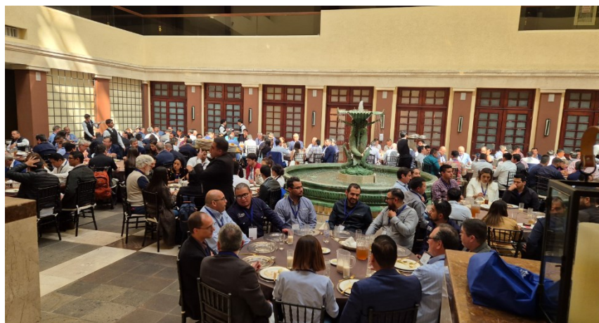
Comida con asistentes del simposio.