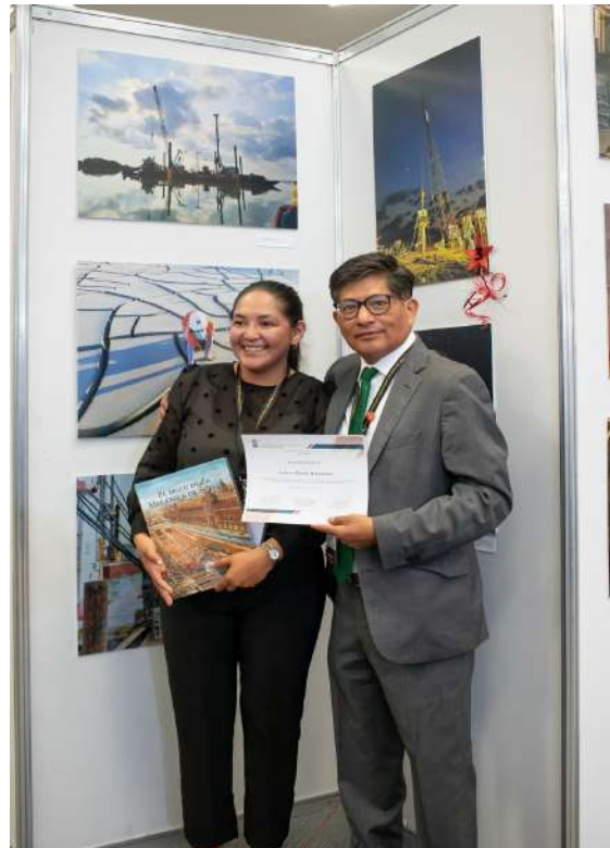
Premiación del primer y tercer lugar en categoría individual.