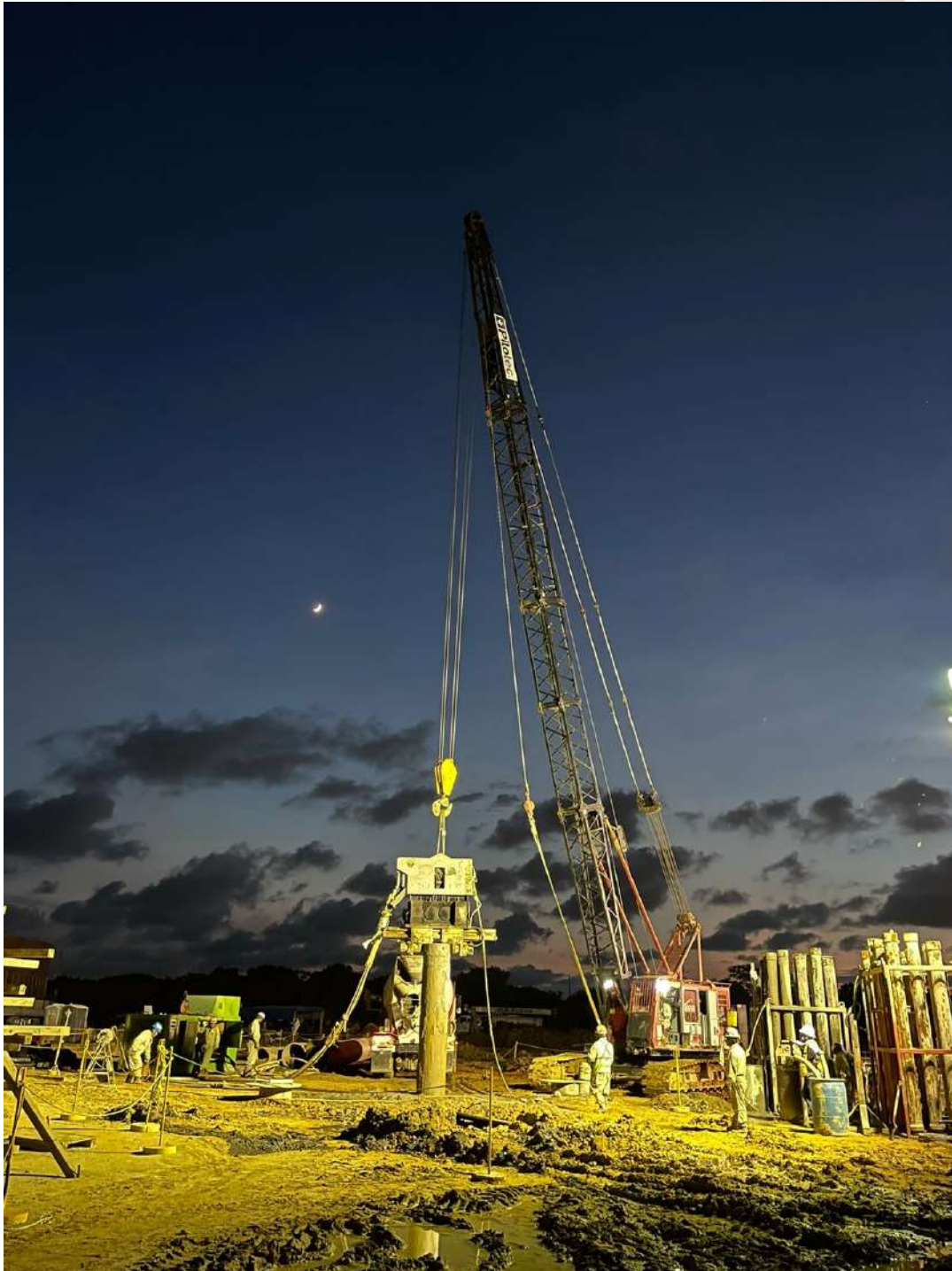
Autora: Leticia Pineda Hernández | Título: Soñé que podía | Descripción: Construcción de pilas a 40m con mejoramiento de suelos mediante compactación dinámica | Año: 2023 | Obra: Terminal Jaguar de Etano | Lugar de la obra: Coatzacoalcos, Veracruz.