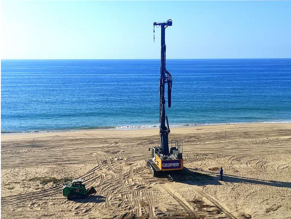
Autor: Manuel Alejandro de la Paz Cázares | Título: "Cimentando la orilla de la playa" | Descripción: Densificación de arenas y mitigación de impacto ambiental, Mejoramiento de suelo para resort | Año: 2023 | Obra: Nauka | Lugar de la obra: Compostela, Nayarit.