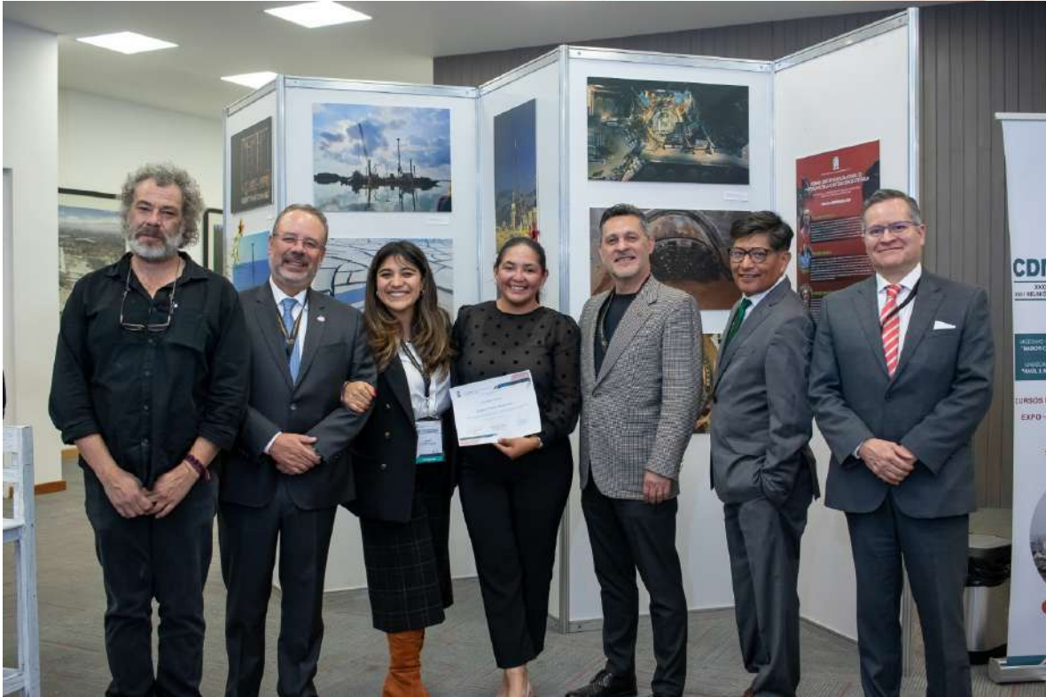
Ceremonia de premiación del primer Concurso Internacional de Fotografía en la Construcción Geotécnica.