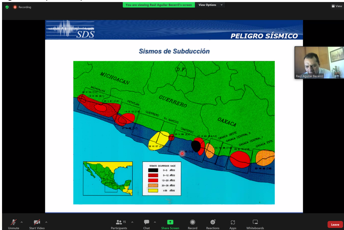
Figura 2. Captura de pantalla del Curso de Dinámica de suelos. Tema 1 Peligro sísmico.